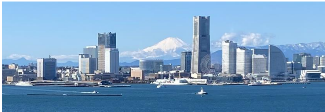
100年前の横浜は、関東大震災で壊滅した被災地だった・・・