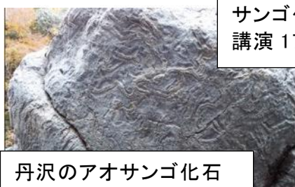
丹沢のアオサンゴ化石

耐震補強実験模型、微動計、救出ボックス、AED アイデア防災グッズ、防災ドローン等実物展示 触れる、実験する、体験できるものもあり